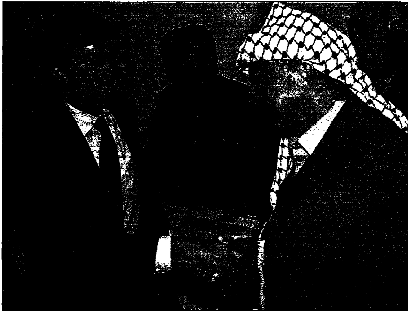
الرئيس عرفات يصافح المبعوث الأمريكي ديفيد روبنسون معقر السلطة الوطنية الفلسطينية في رام الله

غزة - رام الله - هـ. ب. رويترز: قام الرئيس الفلسطيني ياسين عرفات أمس الثلاثاء بزيارة الشيخ أحمد ياسين مؤسس حركة المقاومة الإسلامية (حماس) في منزله بقطاع غزة. وقال شهود عيان إن عرفات احتضن وقبل الشيخ ياسين مؤسس الحركة وناداه، وبوطنية. وتهدد عرفات وياسين اللذان يتزعمان جماعتين فلسطينيتين منافستين بالوحدة. وقال ياسين (61 عاماً) للصحافيين بينما يقف عرفات إلى جواره أنهم شعب واحد وامة واحدة ولن يسمحو بجانحه، لأنه للإمامات والأعداء بشق وحده صف الشعب الفلسطيني. ورداً على سؤال حول تأثير عودة الشيخ ياسين بعد ثمانية سنوات في السجون الإسرائيلية على الفلسطينيين قال عرفات إن عودته ستخزن دون شك الوحدة الوطنية وتجعلها أكثر استقراراً وقوة وأخوة. وقام عرفات بزيارة الشيخ أحمد ياسين فور وصوله غزة أمس في سيارة مرموقة من رام الله حيث التقى مع مقره في المدينة أمس المتسقى الإسرائيلي لحملة السلام ديفيد روس للمرة الثانية. وقال روس في تصريح للصحافيين في ختام اللقاء معلناً عن اتفاق الجانبين الفلسطيني والإسرائيلي يوم أمس الأول على استئناف عمل لجان المفاوضات الفلسطينية مع الجانب الإسرائيلي في إطار العملية السلمية. وأضاف أن الجانبين اتفقا على أن يفتحوا المفاوضات في رام الله في 15 من الشهر الجاري. وكان الجانب الإسرائيلي قد وافق على وقف إطلاق النار لمدة 18 شهراً في إطار عملية السلام. وقال ياسين إن هذا الاتفاق هو بداية لعملية سلام حقيقية بين الجانبين. وقال ياسين إن هذا الاتفاق هو بداية لعملية سلام حقيقية بين الجانبين. وقال ياسين إن هذا الاتفاق هو بداية لعملية سلام حقيقية بين الجانبين.